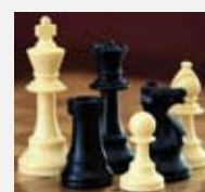
Alight – commonswiki, GNU Free, Wikipedia.org

fängerInnen wird Hilfe und Unterstützung durch eine Fachkraft gegeben.